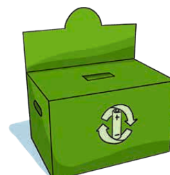
Sammelbox für Batterien